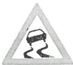
fig. 1 – Drum alunecos