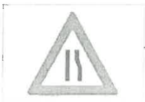
fig. 3 – Drum îngust